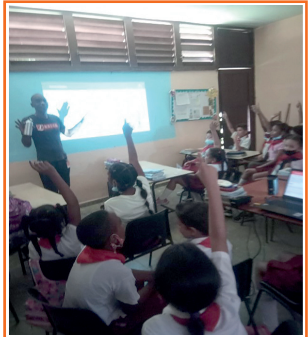
Imagen 2. Clase de conceptos básicos sobre el fuego.