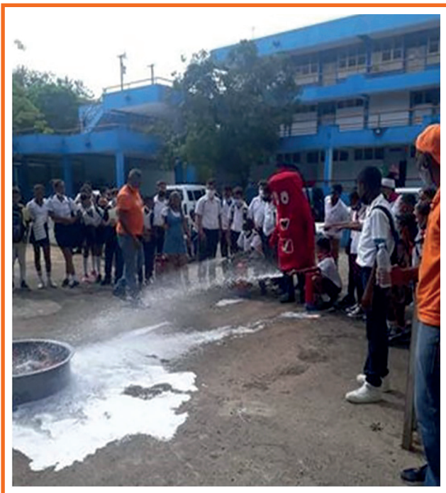
Imagen 4. Ejercicios preventivos.