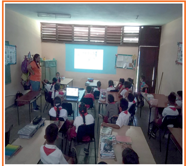
Imagen 3. El extintor. Partes. Usos.