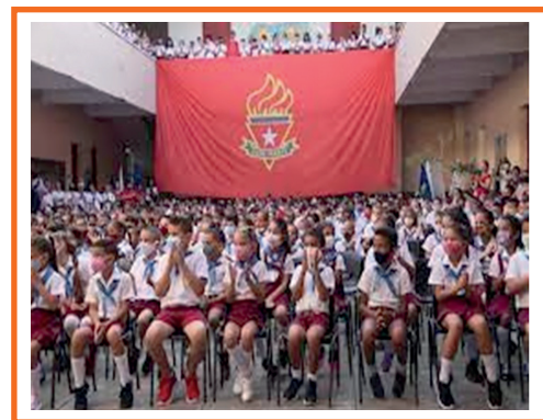
Imagen 9. Acto político en el Palacio Central de Pioneros Ernesto Guevara.

Participación de trabajadores de la empresa en actos estudiantiles como el cambio de pañoleta. (Imagen 9).