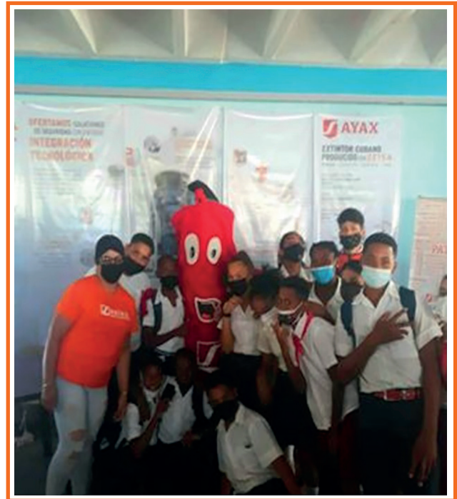
Imagen 5. Exposición Municipal de círculos de interés.