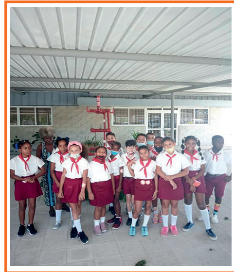
Imagen 8. Presentación del círculo de interés en Expoferia del 2do Simposio Seisiano.