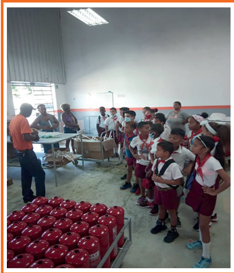
Imagen 6. Visita a la Filial Complejo Roberto Labarca Buides.