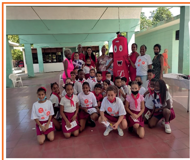
Imagen 1. Círculo de interés “Aprendiendo con SEISÍN”.

La formación vocacional trabaja en el progreso de la esfera motivacional, cognitiva, y en el desarrollo de un conjunto de características como la disciplina, la persistencia y la responsabilidad. Los elementos que influyen en esta son: la familia, la escuela y la sociedad. El estudiante es considerado como sujeto activo de su propio proceso de formación vocacional, a través de una adecuada integración académica, laboral e investigativa.