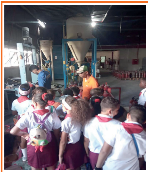
Imagen 7. Proceso de llenado Industrial de Sistemas Contra Incendios del extintor AYAX.